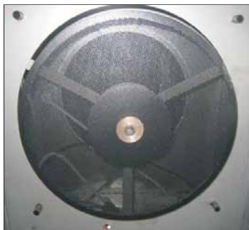
8. Montera separationsplåten med muttern i centrum.