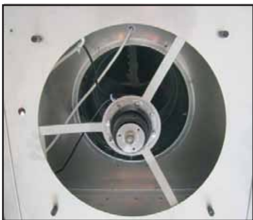
7. Lyft motorn på plats, fixera muttrarna och anslut snabbkopplingen.