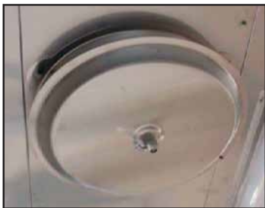
9. Återmontera täckplåten och slå på strömmen. Kontrollera att indikatorlampan på filtret lyser.